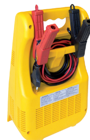
Opbergruimte voor kabels en klemmen.