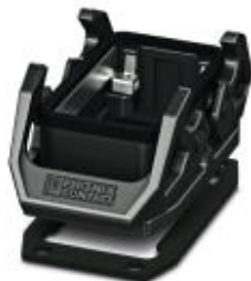
HEAVYCON EVO-aanbouwbehuizing van kunststof, B10, met dwarsbeugels, hoogte: 30,5 mm, met vlakke afdichting

Houd er a.u.b. rekening mee dat de hier aangegeven gegevens uit de online catalogus afkomstig zijn. De volledige informatie en gegevens vindt u in de gebruikersdocumentatie. De Algemene gebruiksvoorwaarden voor internet-downloads zijn van toepassing. ( http://phoenixcontact.nl/download )