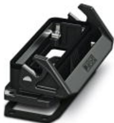
HEAVYCON EVO-aanbouwbehuizing van kunststof, B24, met lengtebeugel, hoogte: 30,5 mm, met vlakke afdichting

Houd er a.u.b. rekening mee dat de hier aangegeven gegevens uit de online catalogus afkomstig zijn. De volledige informatie en gegevens vindt u in de gebruikersdocumentatie. De Algemene gebruiksvoorwaarden voor internet-downloads zijn van toepassing. ( http://phoenixcontact.nl/download )