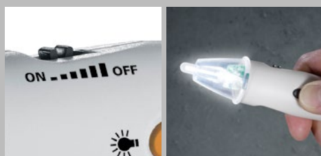
Instelbare gevoeligheid Zaklamp