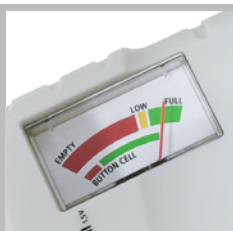
Goed af te lezen, 3-kleurige schaal