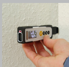
Pin voor metingen vanuit de hoek