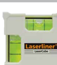
Eenvoudige uitlijning dankzij de libellen