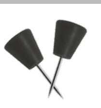
Speciale pennen voor bevestiging