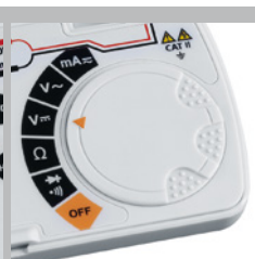
Eenvoudig te bedienen functiedraaiknop