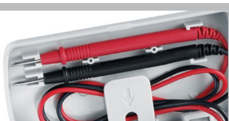
Houder voor de meetpunten