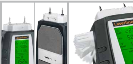
Exacte puntmeting en materiaalvriendelijke oppervlaktescan