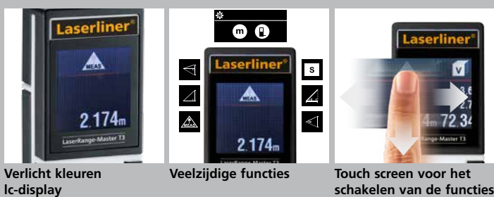
Verlicht kleuren Ic-display

LaserRange-Master T3 inclusief transporttas + batterijen (2 x 1,5 V Typ AAA) Verpakkingsformaat (B x H x D) 113 x 236 x 64 mm