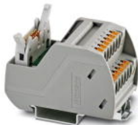
VARIOFACE-interfacemoduul, met push-in-aansluiting, voor 8 kanalen

Houd er a.u.b. rekening mee dat de hier aangegeven gegevens uit de online catalogus afkomstig zijn. De volledige informatie en gegevens vindt u in de gebruikersdocumentatie. De Algemene gebruiksvoorwaarden voor internet-downloads zijn van toepassing. ( http://phoenixcontact.nl/download )