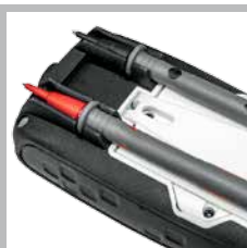
Houder voor de meetpunten