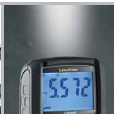
Superfelle, geïntegreerde zaklamp