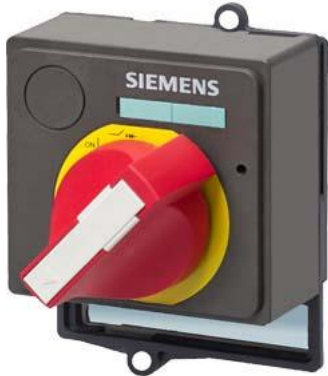
Zubehör für VL1250, VL1600, Frontdrehantrieb NOT-AUS, rot/gelb