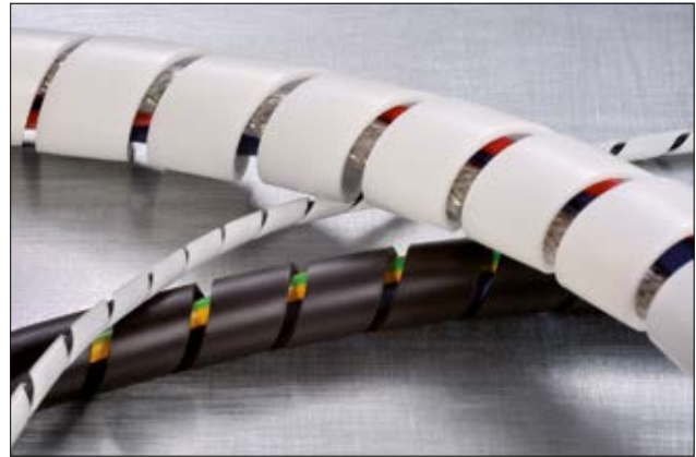
Spiraalslang SBPEFR is beschikbaar in meerdere diameters, in zwart en wit.