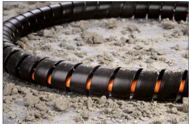
SPF-spiraalslang is extreem robuust en slijtvast.