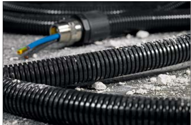
HelaGuard HG-SW voor elektrotechnische en industriële applicaties.