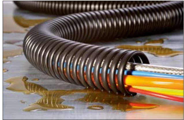
SPS-spiraalslang is zeer robuust en oliebestendig.