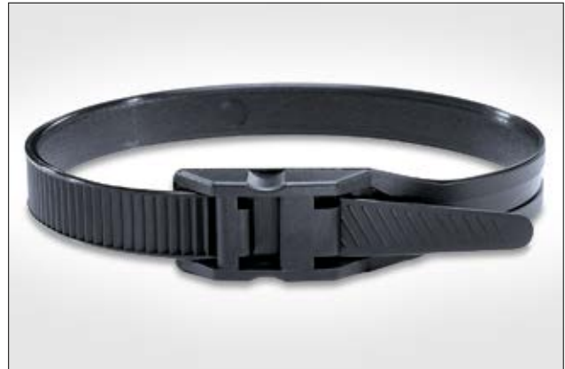
LPH-serie, bundelband met vlakke kopgeometrie.