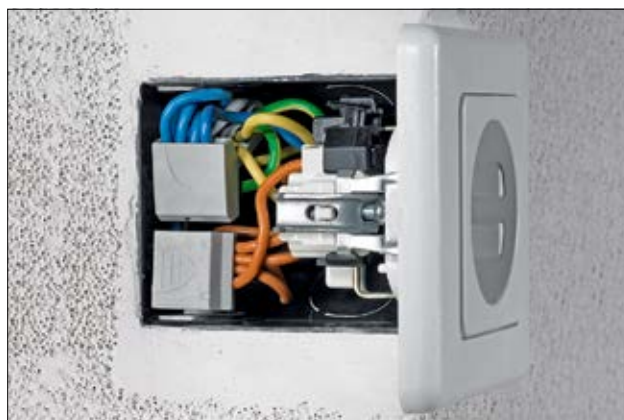
Het compacte ontwerp van HelaCon Easy past uitstekend in kleine ruimten.