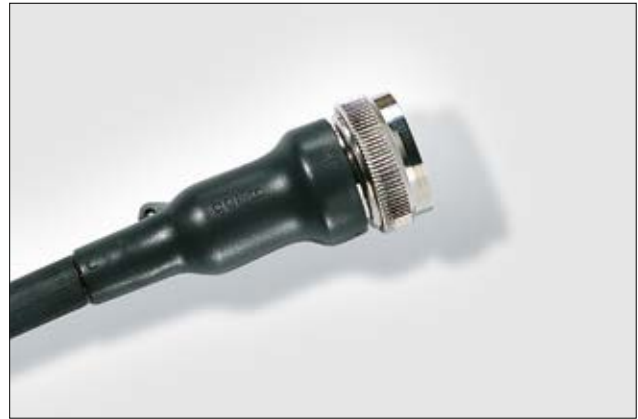
150-serie vormstuk om een connector.

Materiaal- en lijmsorten informatie vindt u op pagina 252, 253.