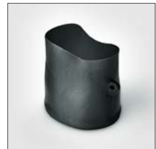
150-serie bij uitlevering.