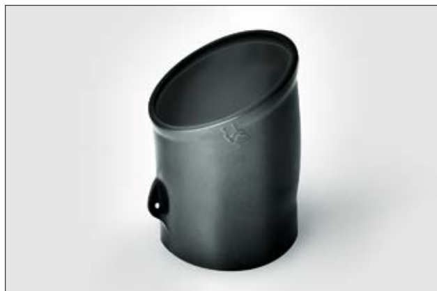
1155-4 bij uitlevering.

Materiaal- en lijmsorten informatie vindt u op pagina 252, 253.