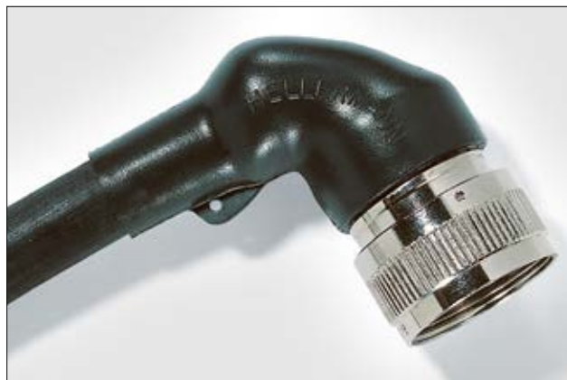
1152-4-G gekrompen om een connector.