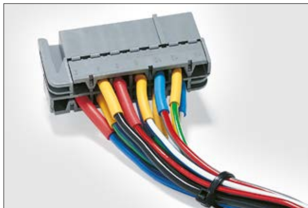
De krimpkous HFT-A met goedkeuring voor defensie applicaties.