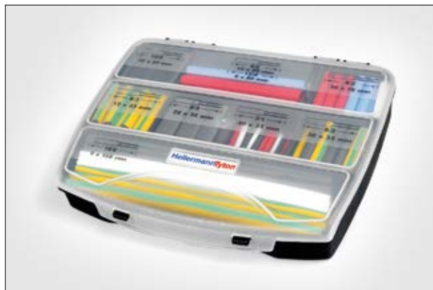
ShrinkKit 321 Universal Basic.