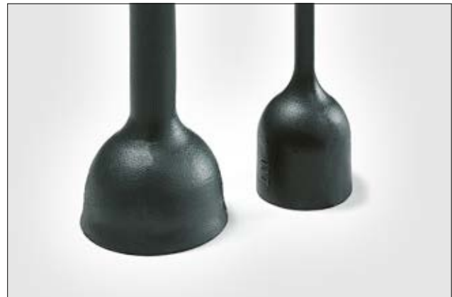
177-1-G voor krimp / na vrije krimp.