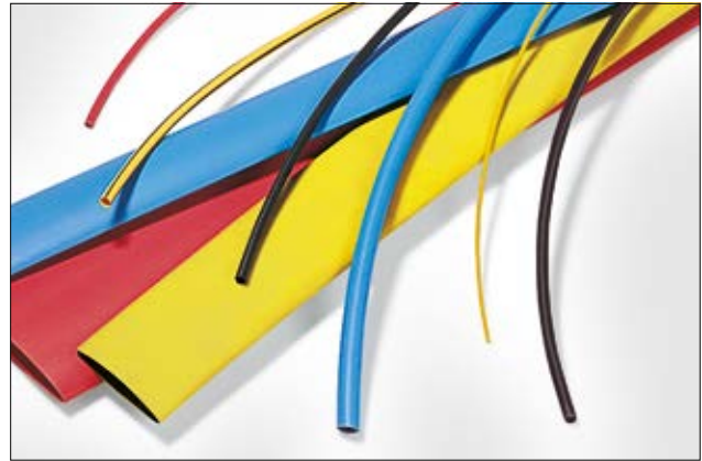
TF21 – leverbaar in vele kleuren en afmetingen.