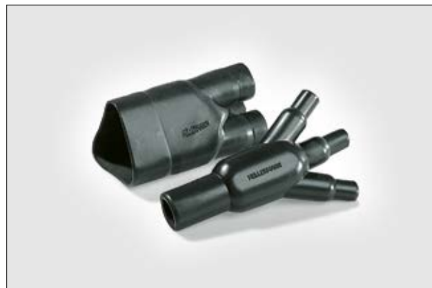
304-1-G voor krimp / na vrije krimp.