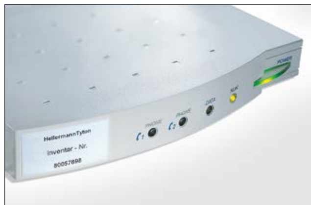
Labels voor duurzaam markeren van inventarisgoederen.