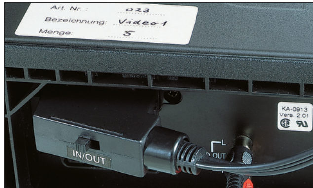
Snel markeren van componenten, ook op oneffen oppervlakken.