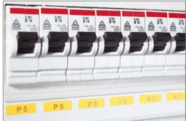
Markering van componenten in de schakelkast.