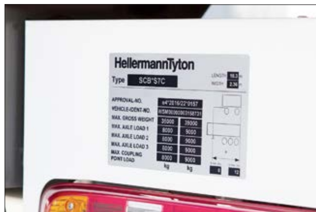
Typeplaat met beschermplaminaat van een HGV-trailer.