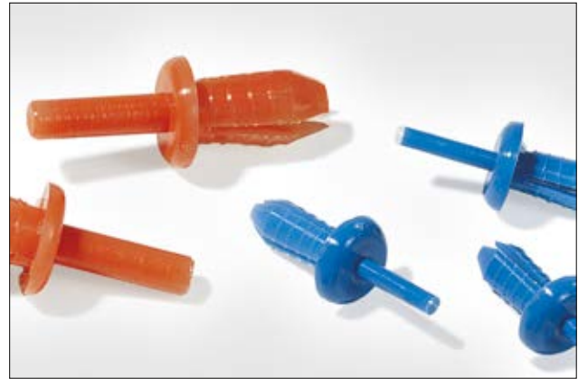
HTWD-R4 en HTWD-R6 spreidnagels.