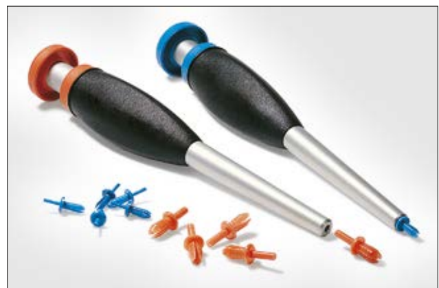
HTWD-RT4 en -RT6 gereedschap voor spreidnagels.