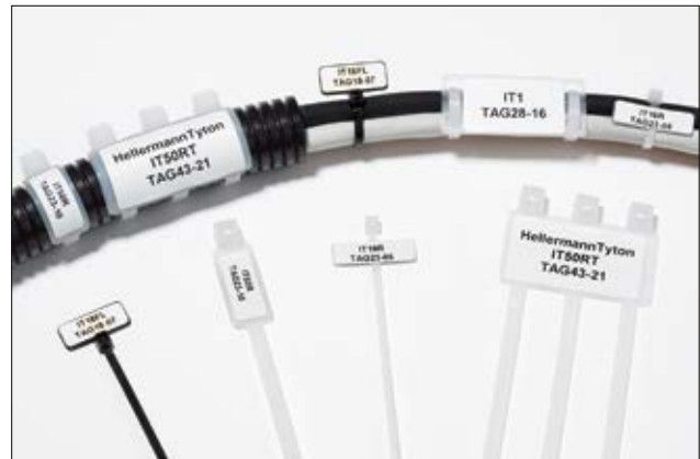
Identificatiebanden en -plaatjes.