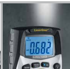
Superfelle, geïntegreerde zaklamp