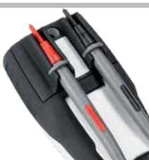
Houder voor de meetpunten