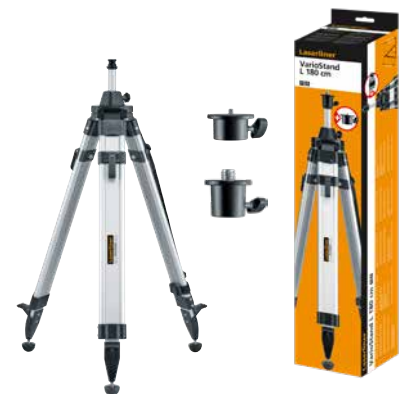
VarioStand L 180 cm + 1/4"-schroefdraadadapter + 5/8"-schroefdraadadapter Verpakkingsformaat (B x H x D) 195 x 950 x 180 mm