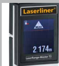
Verlicht kleuren Ic-display