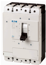
Lastscheider N3, 4p, 630A