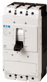
Lastscheider PN3 3p, 400A