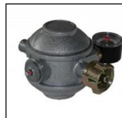
DRUCKREGLER 424 DT

Metallrückwand für maximale Sicherheit und Zuverlässigkeit.