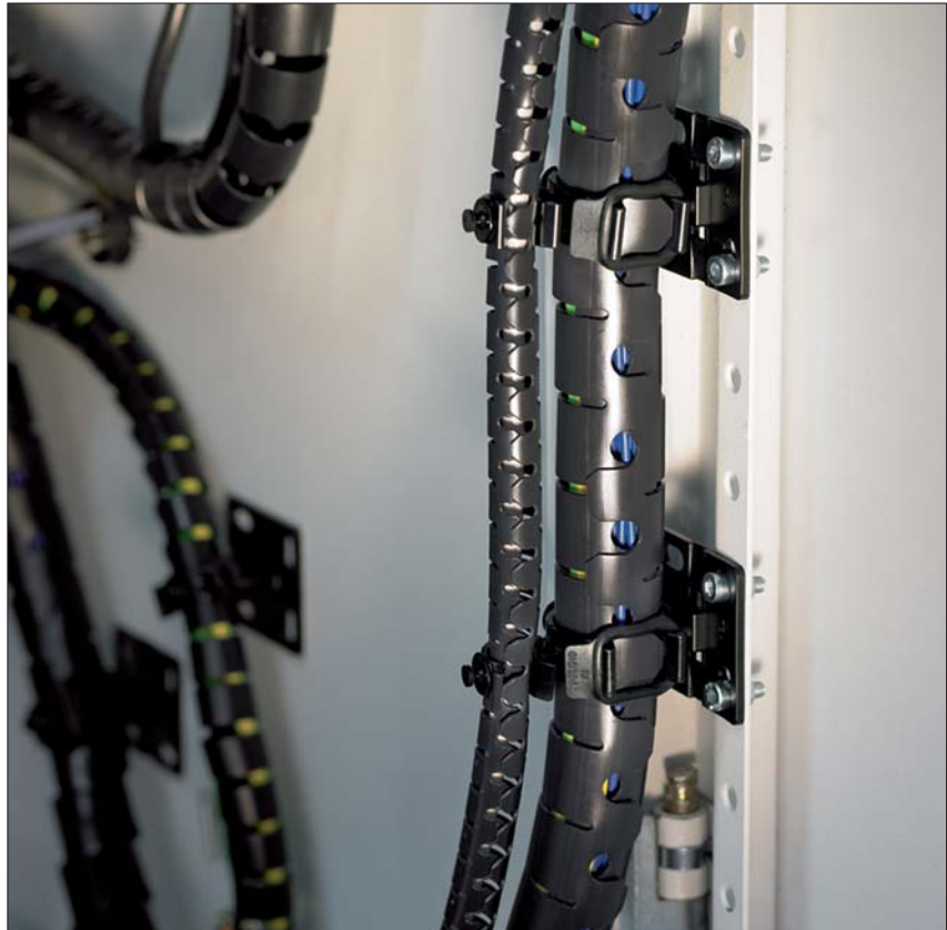
System zarządzania okablowaniem Helawrap umożliwia wiązanie, mocowanie i ochronę przewodów w rozdzielnicach i maszynach przemysłowych.