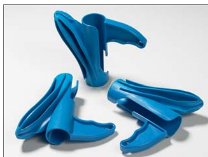
Narzędzia HAT są dostępne do każdej średnicy węży osłonowego.

Nowe narzędzia montażowe Helawrap umożliwiają łatwy i szybki montaż przewodów. Aplikator został zoptymalizowany do gładkiego i bezpiecznego ślizgania się wewnątrz węży osłonowego i łatwiejszego wprowadzania przewodów do niego. Unikalna konstrukcja narzędzia umożliwia wydzielenie i wyprowadzenie dowolnego przewodu na zewnątrz w dowolnym miejscu osłony. Narzędzie jest dołączone do każdego opakowania 25 i 2 m. Dodatkowe narzędzia można kupić oddzielnie.