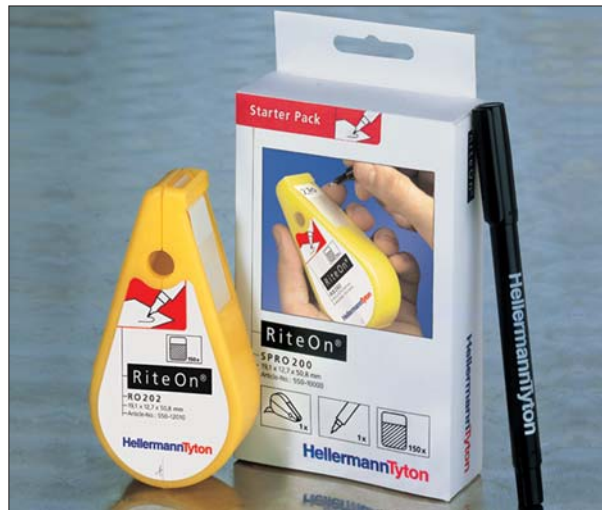
RiteOn Starter Pack umożliwia natychmiastowe zastosowanie.