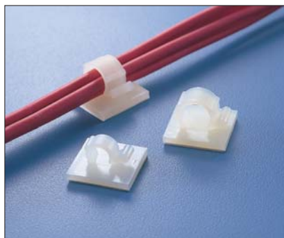
Jednoczęściowe uchwyty typu RA - szybka i prosta instalacja.

Uchwyty tego typu nadają się idealnie do stosowania w miejscach o utrudnionym dostępie, gdzie klejenie jest jedyną możliwą metodą mocowania.