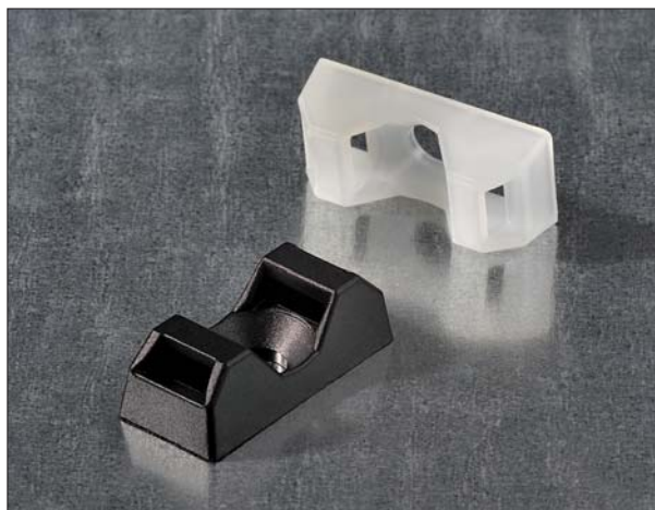
Elementy mocujące CTQM, 2 wejściowe, przykręcane.

Cokoły Q-mount są one idealnym rozwiązaniem we współpracy z opaskami Q-tie. Q-mount utrzymuje opaskę Q-tie na miejscu w czasie montażu wstępnego i zapewnia, że Q-tie nie wyśliznie się z cokołu, nawet w trudnych sytuacjach, jak na przykład przy montażu pionowym.