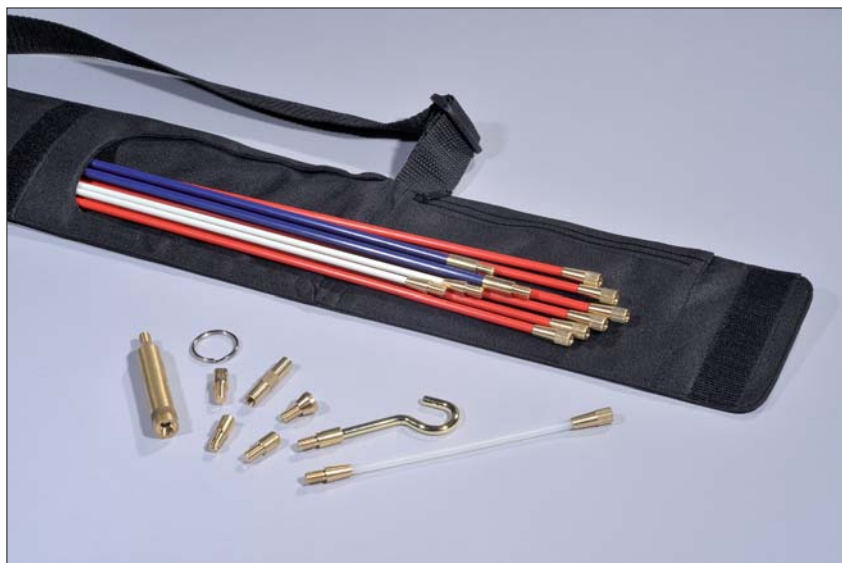
Przegląd wszystkich elementów zestawu Cable Scout+ DeLuxe.

Cable Scout+ jest profesjonalnym narzędziem do instalacji przewodów pozwalającym na szybki i wygodny montaż przewodów i kabli, także w trudnodostępnych miejscach. Drążki są wykonane z tworzywa sztucznego wzmocnianego włóknem szklanym (GRP), zakończone metalowymi złączami gwintowanymi i pozwalają na przeciąganie kabli o wadze do 80 kg. Narzędzie jest również przeznaczone do prac inspekcyjnych, w szczególności do oświetlania trudnodostępnych miejsc i wyciągania przewodów lub innych elementów. Kompletny system zawiera drążki o różnej giętkości, paletę użytecznych akcesoriów oraz torbę do przechowywania wszystkich elementów razem.