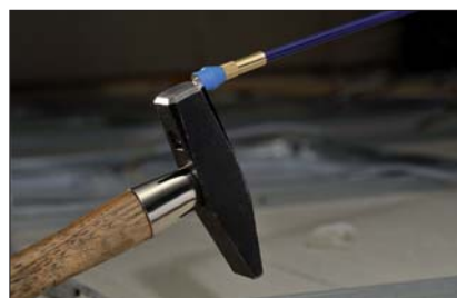
Magnes neodymowy pozwala na podnoszenie metalowych narzędzi do 2,5 kg.