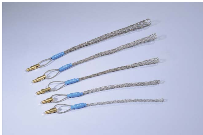
Uchwyty kablowe są dostępne w pięciu różnych rozmiarach, dopasowane do szerokiego wachlarza średnic przewodów.

Uchwyty kablowe zostały opracowane w celu łatwego, szybkiego i bezpiecznego zamocowania przewodów, kabli i rur do narzędzia Cable Scout. Wystarczy ścisnąć stalowy opłot uchwytu kablowego, wprowadzić przewód do środka i puścić. Opłot rozpręży się opasując przewód dookoła i zapewniając pewne zamocowanie do narzędzia. Uchwyty kablowe są dostępne w pięciu rozmiarach do przewodów o średnicy zewnętrznej od 4 do 30 mm.