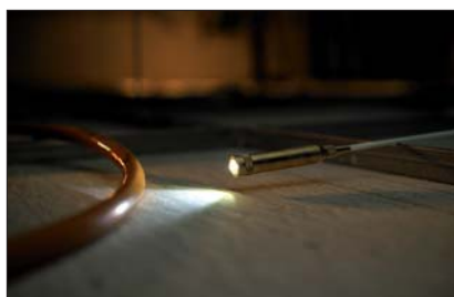
Mikrolatarka - perfekcyjne narzędzie do oświetlania ciasnych przestrzeni.

Zastrzeżone prawo do ewentualnych zmian technicznych.