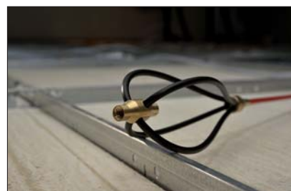
Trzepakczka ułatwia przeciąganie przewodu po nierównej powierzchni.