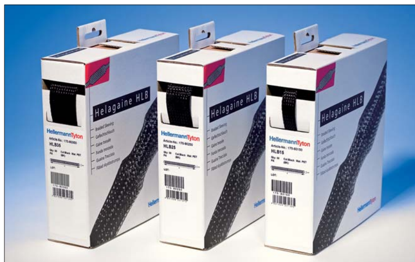
Helagaine HLB: trzy rozmiary obsługują cały zakres standardowych średnic.

Oplot stosuje się do związania i do zabezpieczenia przewodów przed uszkodzeniami mechanicznymi. Pudełka z oplotem nawiniętym na rolkę są bardzo przydatne przy zastosowaniach warsztatowych, zarówno profesjonalnych, jak i domowych.