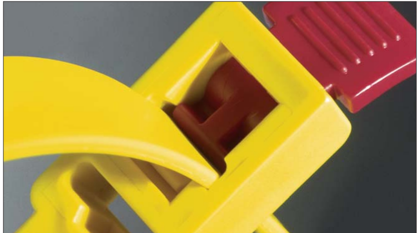
Opatentowany mechanizm szybkiego zwalniania opaski.

Rozpinalna opaska montażowa do wielokrotnego użytku. Opatentowany zamek „Speedy-Click” umożliwia szybkie zwalnianie opaski, a jednocześnie zapewnia możliwość obciążenia opaski do 888 N (ok. 90 kg). SpeedyTie o długości 750 mm oferuje szeroki wachlarz zastosowań i umożliwia rozpięcie bez zdejmowania rękawic ochronnych. Niewykorzystany koniec opaski można łatwo włożyć w uchwyt w główce tak, aby nie przeszkadzał. Opaski są dostępne w kolorze żółtym, ostrzegawczym oraz w czarnym.