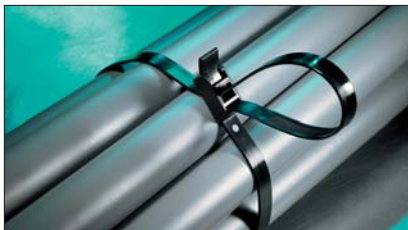
SpeedyTie – szybko i łatwo.