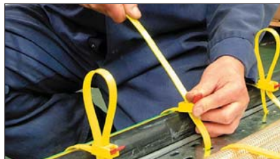
Koniec opaski można wprowadzić z powrotem do główki.