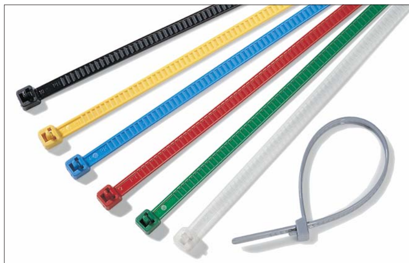
Opaski rozpinalne LR55 nadają się idealnie do kolorowych oznaczeń.

Opaski rozpinalne przeznaczone są do wielokrotnego użytku przy montażu czasowym lub gdy wymagane jest częste zakładanie i zdejmowanie opasek, np. do oznaczeń logistycznych, przemysłu opakowaniowego i produkcji wiązek kablowych. Mogą być także używane do oznaczeń barwnych.