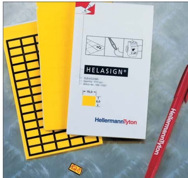
Wszystko pod ręką: Etykiety w wygodnej i lekkiej, kieszonkowej książeczce.