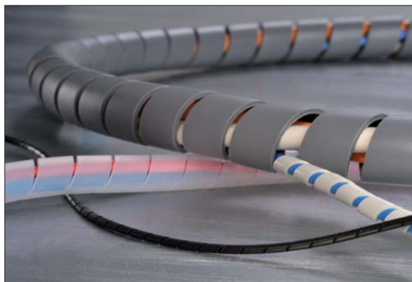
Wąż spiralny SBPE.

Węże spiralne są używane głównie w instalacjach elektrycznych, przy panelach i szafkach sterowniczych oraz przy budowie rozdzielnic. Opakowania 30 m są stosowane w zastosowaniach przemysłowych. Do mniejszych potrzeb przeznaczone są węże SBPE w praktycznych 5 m odcinkach, dostępne w dwóch najpopularniejszych rozmiarach 4 i 9.