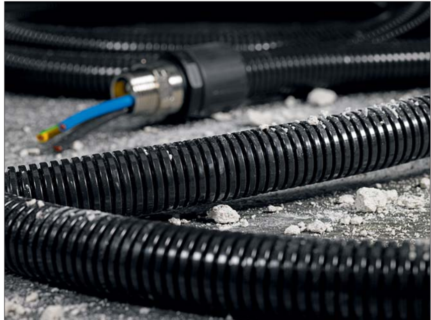
HelaGuard PA6 Standard w zastosowaniu przemysłowym.