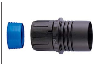
Reduktor HG-R z uszczelką rury, IP68.