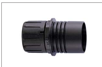
Reduktor HG-R, IP66.